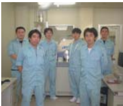
特殊部のメンバーです。ちなみに筆者は左から二番目。

精度管理(品質)を高めることが業界内に求められた社会ニーズでしたが、今ではスピードも求められ、急激な分析単価の下落、さらに追い討ちをかけるようにして原油の高騰による分析材料の値上げなど私たちを取り囲む社会情勢は厳しさが増す中ですが、この社会ニーズにこたえていくよう全社員一丸となつて取り組んでいきたいと思えます。